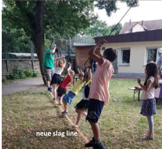
neue slag line