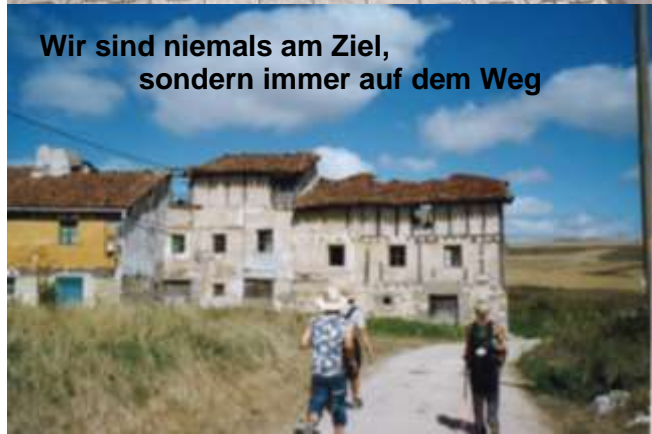
Wir sind niemals am Ziel, sondern immer auf dem Weg