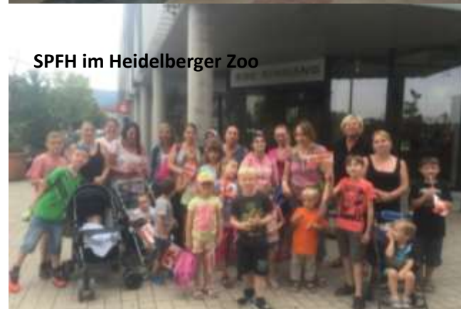
SPFH im Heidelberger Zoo