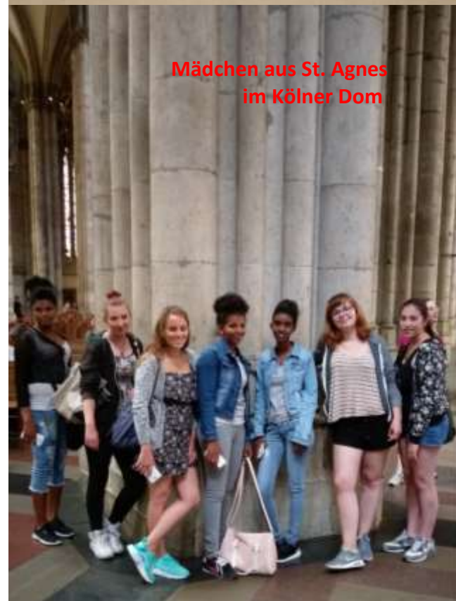
Mädchen aus St. Agnes im Kölner Dom