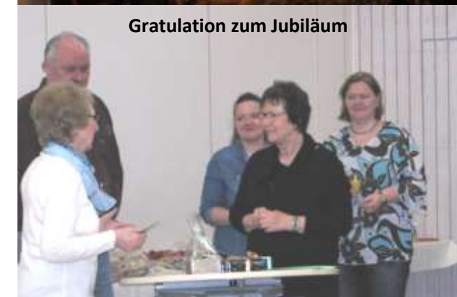
Gratulation zum Jubiläum