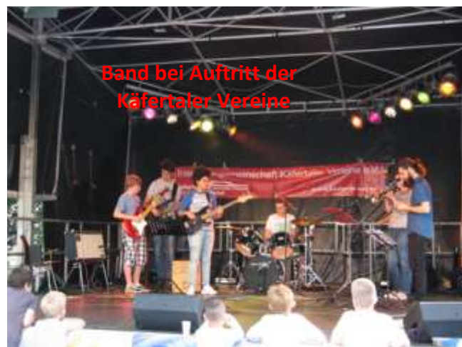
Band bei Auftritt der Käfertaler Vereine