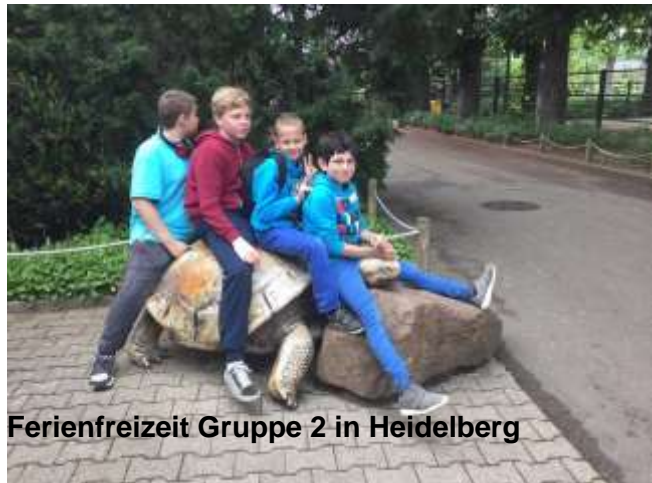
Ferienfreizeit Gruppe 2 in Heidelberg